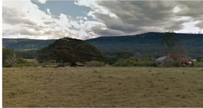
La propriété Marceau à Kembla Grange dans son état actuel