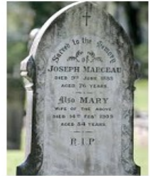
La sépulture située à Kembla Grange

Son héritage survit à travers ses descendants et son nom est honoré par la rue Marceau à Wollongong et l'allée Marceau à Canada Bay.