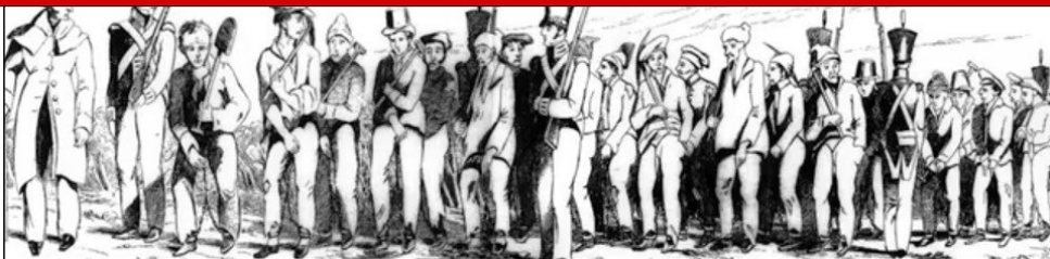
LA BAIE DES EXILÉS: REVISITÉ

Ce documentaire sera présenté les 18 et 20 mai prochains dans le comté de Wollongong en Australie.